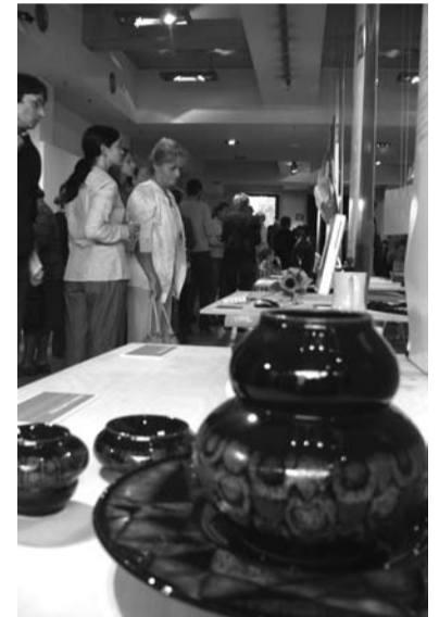
„Dizajn stela” pokazuje, że także lokalne firmy mają świetne pomysły, które są doceniane na świecie