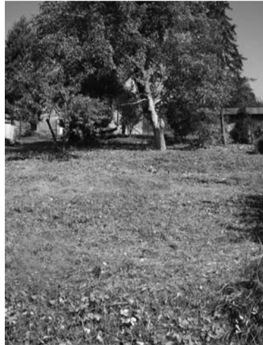
Grunt przeznaczony do dzierżawy przy ul. Mickiewicza

Bliższych informacji w tej sprawie można zasięgnąć pod numerem telefonu 33 4794 230 lub 33 4794 278 .