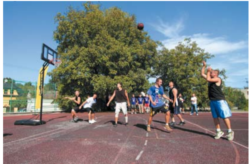
Mecze koszykówki odbywały się na boiskach po obu stronach Olzy