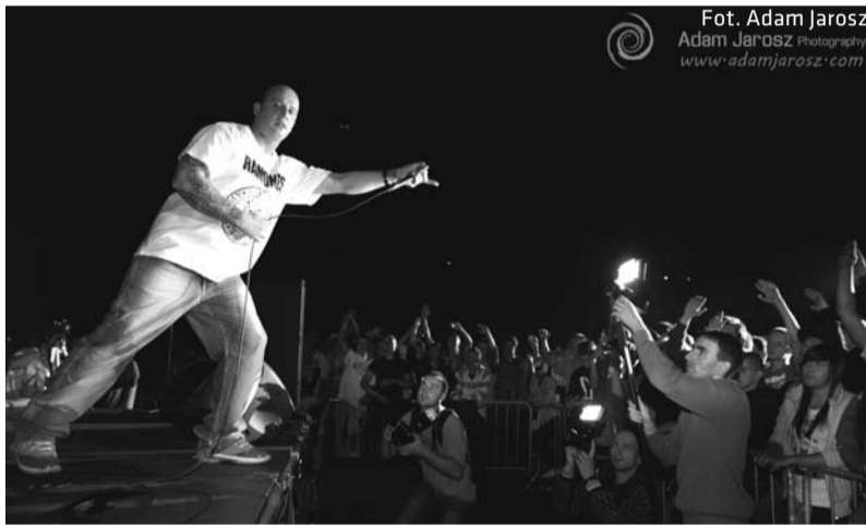
Koncert Peji zgromadził tłumy młodzieży