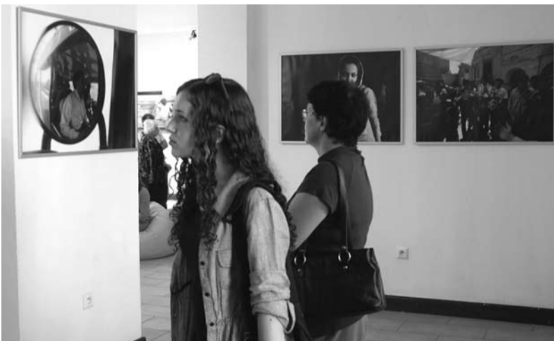
Zdjęcia Łukasza Jaworskiego to opowieść o ludziach żyjących w Indiach i Iranie, ich obyczajach