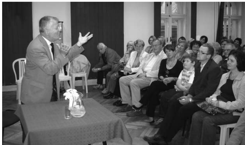
Pełne ekspresji wystąpienie profesora Miodka

Wizyta wybitnego językoznawcy w cieszyńskiej Bibliotece zakończyła się pozowaniem do zdjęć oraz rozdaniem wielu autografów.