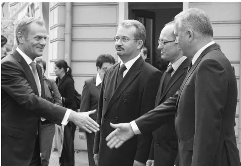
Na otwarciu polsko-czeskiego gazociągu do Cieszyna przyjechał premier RP Donald Tusk