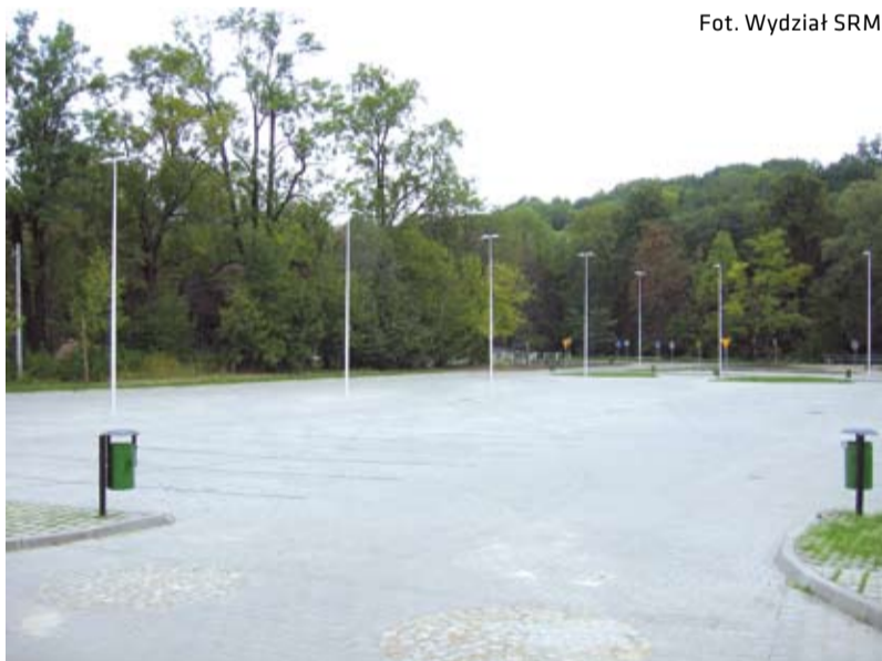
Parking publiczny dla 161 samochodów osobowych oraz 2 autokarów