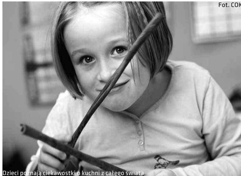
Dzieci poznają ciekawostki o kuchni z całego świata