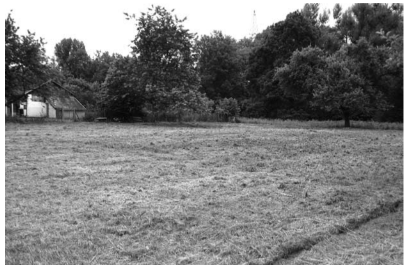
Nieruchomość gruntowa przeznaczona na sprzedaż położona przy ul. Frysztańskiej

Bliższych informacji w tej sprawie można zasięgnąć pod numerem telefonu 33/4794 234, 33/4794 230.