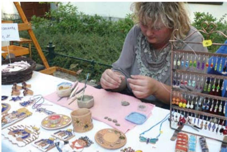
Podczas Jarmarku można było przyglądać się różnym obliczom rzemiosła...

Ponad 40 rzemieślników prezentowało podczas Cieszyńskiego Jarmarku Rzemiosła (odbywającego się w ramach tegorocznej edycji Skarbów z cieszyńskiej trówały) na Wzgórzu Zamkowym bardzo różne oblicza rękodzieła, od tych bardzo tradycyjnych, czasem niemal zapomnianych dziedzin, po współczesne podejście do dawnych technik. Nie zabrakło też okazji, by skosztować regionalnych przysmaków.