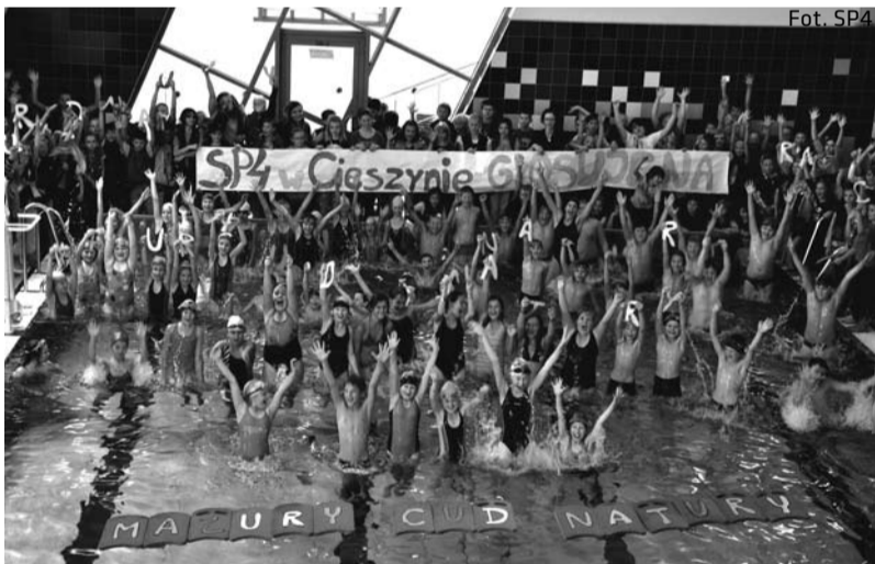
Dzieci z SP 4 zagłosowały na Mazury w międzynarodowym konkursie na Nowe 7 Cudów Natury

Nie chodzi bynajmniej o kolejne zawody pływackie, organizowane w Szkole Podstawowej nr 4, lecz o Pojezierze Mazurskie, które jest jedynym polskim kandydatem w międzynarodowym konkursie szwajcarskiej fundacji New7Wonders na Nowe 7 Cudów Natury.