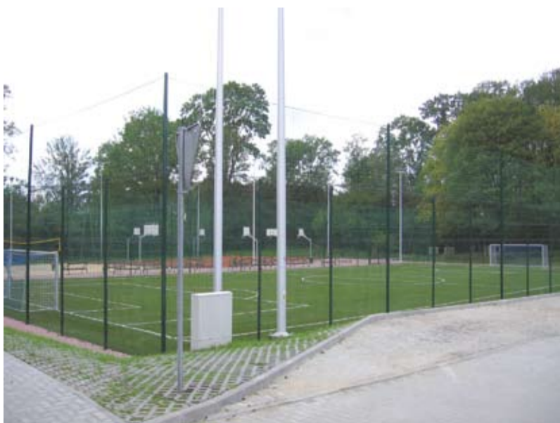
Boisko do piłki nożnej z nawierzchnią ze sztucznej trawy