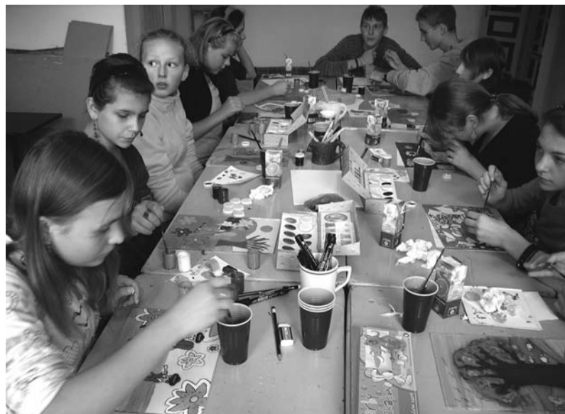
Czas spędzony na zajęciach z rysunku i malarstwa mija bardzo przyjemnie