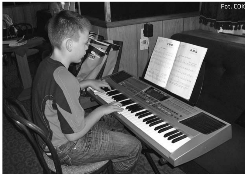
Na zajęciach sekcji muzycznej dzieci i młodzież mają możliwość nauzenia się gry na instrumentach klawiszowych