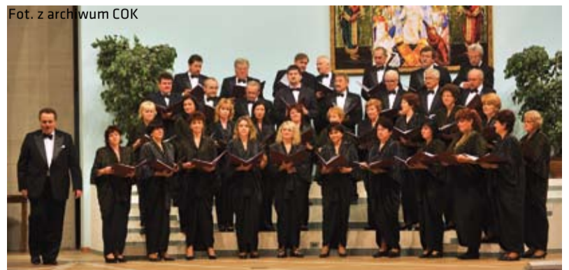
Polski Zespół Śpiewaczy „Hutnik” z Trzyńca wystąpi w Kościele Jezusowym w dniu 12 października