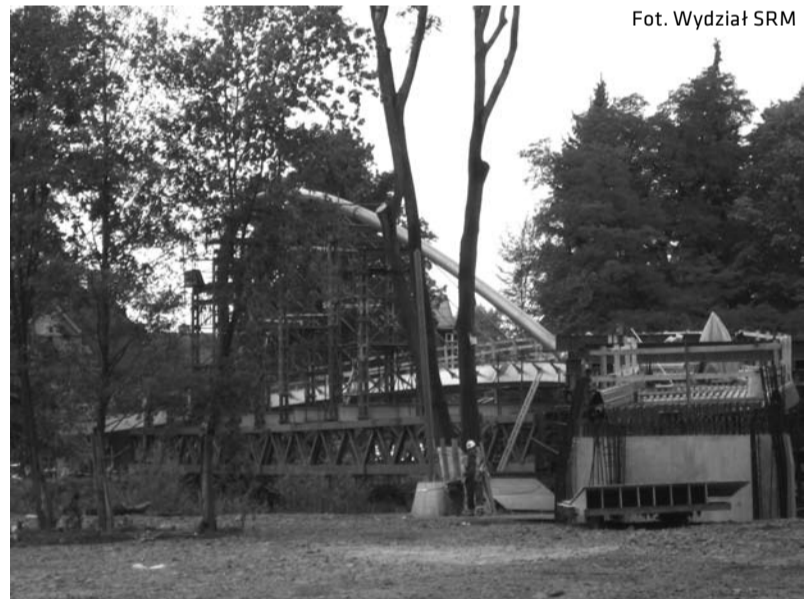
Plac budowy mostu sportowego w Parku Pod Wałką