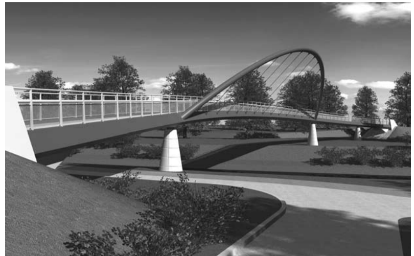
Wizualizacja mostu: widok ze strony czeskiej