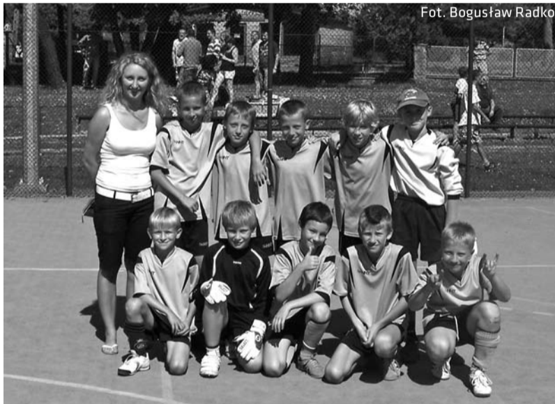
Szczęśliwa zwycięska drużyna ze Szkoły Podstawowej nr 2