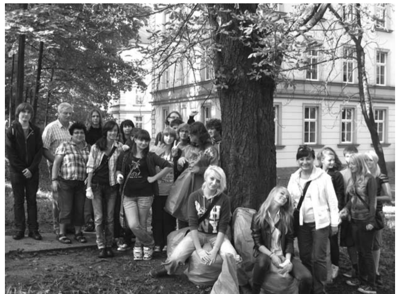
Młodzież z cieszyńskich szkół biorąca udział w akcji Sprzątanie Świata