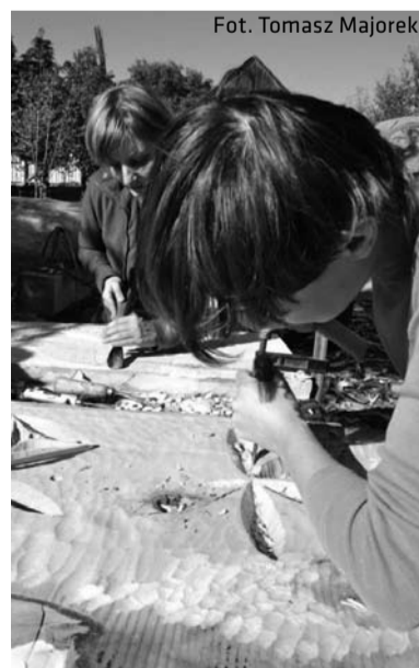
W warsztatach ciesielstwa wzięły udział także panie