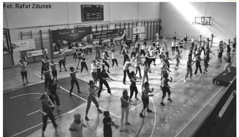
W Maratonie Zumby wzięło udział ponad 100 osób