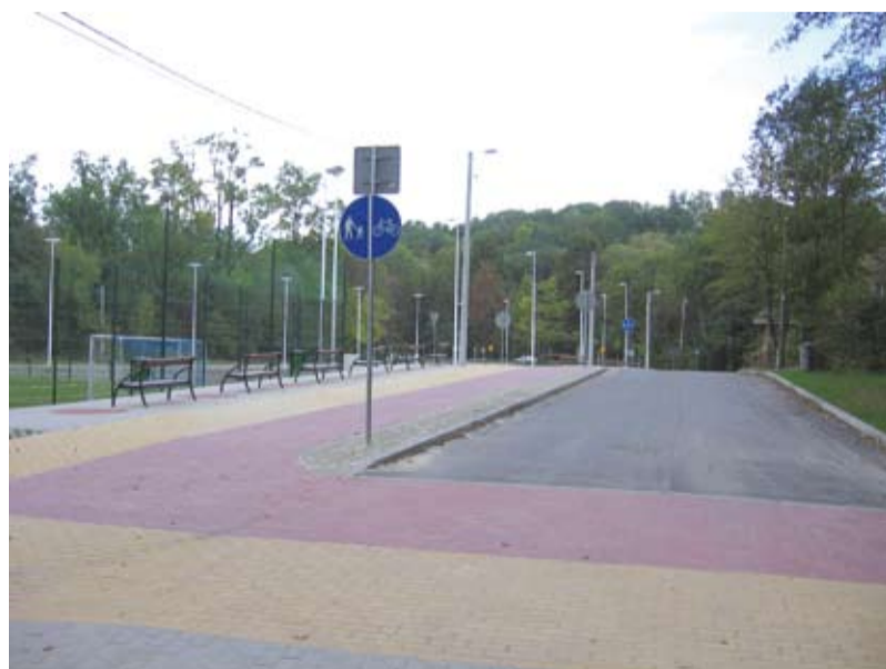
Przebudowana ulica „Bolko” Kantora wraz ze ścieżką pieszo - rowerową