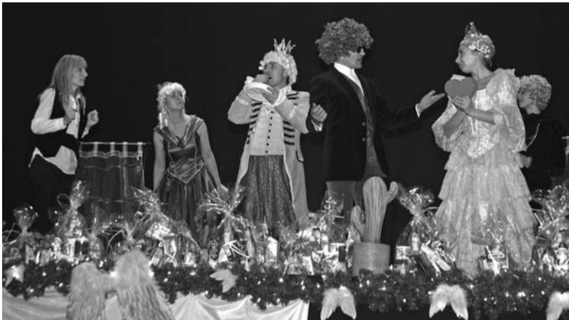
Bajkę „Serce z czekolady” można będzie zobaczyć w Teatrze im. A. Mickiewicza w dniu 19 października